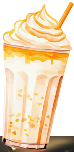
ФОТО С ПРАЗДНИКОВ